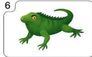
a an iguana