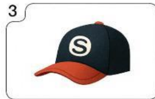
a an cap