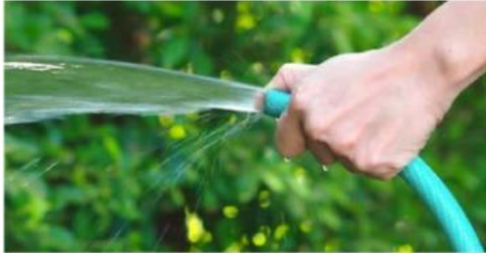
Gambar 1.4 Menyiram Tanaman Pakai Selang

Apakah sebelumnya ananda pernah menyiram tanaman menggunakan selang?