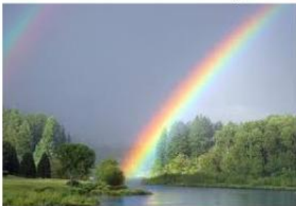
Gambar 1.2 Pelangi

Pernahkah anda melihat hal serupa di kehidupan sehari-hari seperti gambar dibawah ini?