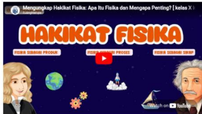
Video 1.1 Hakikat Fisika

Sumber : https://youtu.be/NyGUhQerITU?si=QThYmZRSI_TCASQS