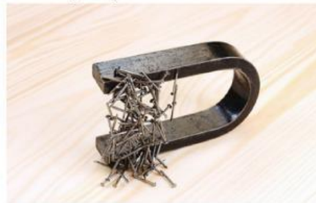
Gambar 1.3 Magnet Menarik Paku-Paku