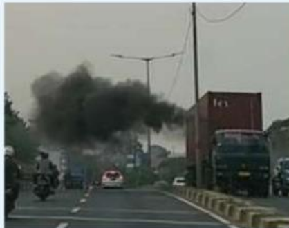
Gambar 2. Contoh asap kendaraan di wilayah Surabaya

Esti Widiyana - detikJatim Selasa, 5 Agustus 2023 13.07 WIB