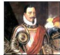
PEDRO DE VALDIVIA 1540 - 1541