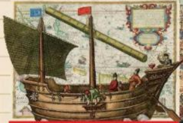
Pelayaran dan perniagaan di Nusantara