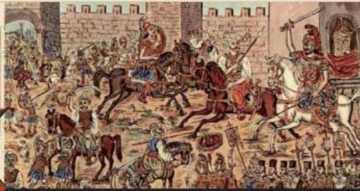
Jatuhnya Konstantinopel ke tangan Turki: