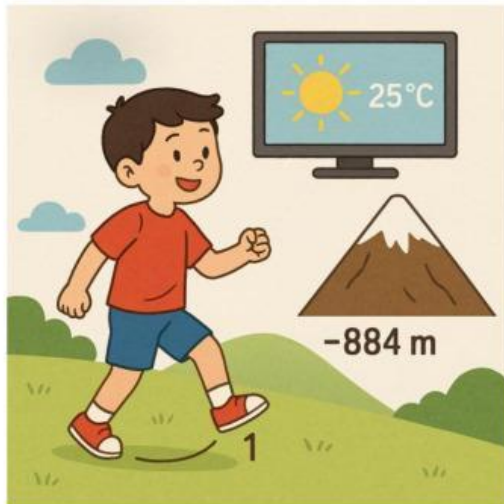
Gambar 1.1 Ilustrasi Bilangan Bulat di Sekitar Kita

Anak-anak, pernahkah kalian menghitung langkah saat bermain, melihat suhu udara di televisi, atau membaca ketinggian sebuah gunung? Tanpa kita sadari, bilangan positif dan negatif hadir dalam banyak aspek di kehidupan kita sehari-hari, kita sering menemukan bilangan, baik bilangan positif maupun bilangan negatif. Yuk, kita pelajari lebih dalam agar kita bisa memahami dan menggunakan bilangan bulat dengan tepat dan terapkan dalam proyek kelompok kita!