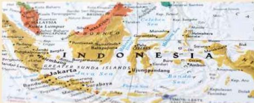
Gambar 1. 1 Peta Indonesia