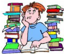
für die Schule lernen