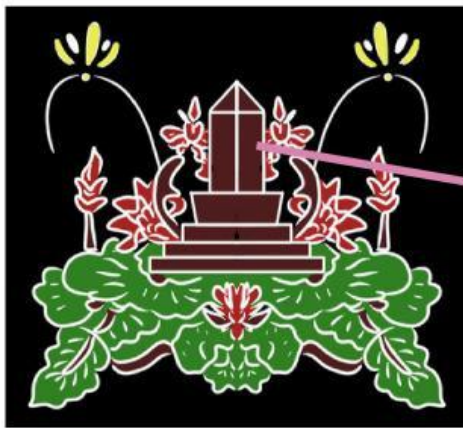
Motif Batik Tugu Malang

Amatilah gambar di bawah ini untuk menjawab soal!