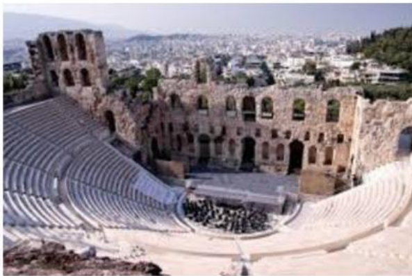
___TEATRO DE ATENAS___