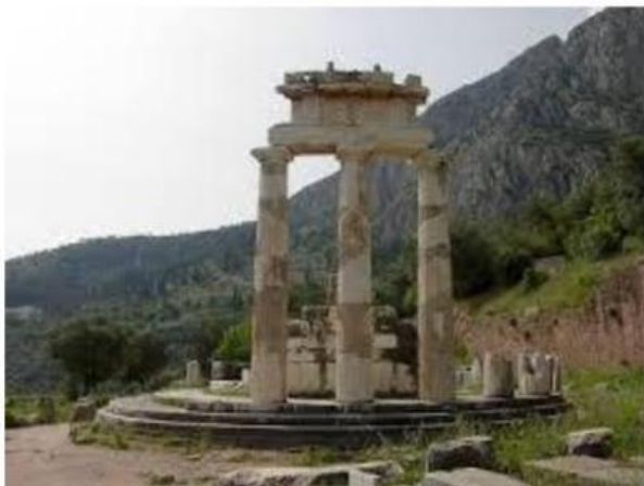
___ORÁCULO DE DELFOS___