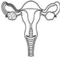
Sistema reproductor femenino

Coordina funciones vitales como el crecimiento, metabolismo, reproducción del cuerpo.