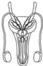
Sistema reproductor masculino

Los huesos protegen órganos vitales, como los que están dentro de la caja torácica.