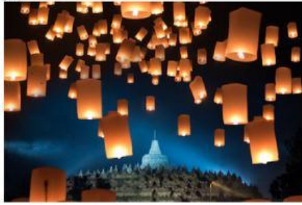
Gambar 1. Lampion Waisak

Perayaan lampion Waisak adalah bagian dari Hari Raya Waisak, yang biasanya dilakukan di Candi Borobudur. Setelah doa dan upacara selesai, umat Buddha melepaskan lampion ke langit.