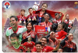
Tim Badminton Indonesia pada SEA Games 2023 Kamboja

SEA Games ( Southeast Asian Games ) merupakan ajang olahraga terbesar di kawasan Asia Tenggara yang diadakan setiap dua tahun sekali. Ajang ini pertama kali diadakan di Bangkok, Thailand pada tahun 1959.