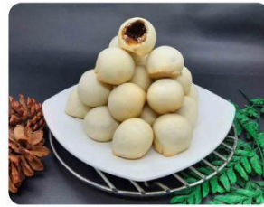
"Kue Nopia"

Nopia merupakan salah satu makanan khas daerah Banyumas yang memiliki rasa enak dengan proses pembuatan yang unik. Kue ini bentuknya bulat tetapi sisi sebelahnya rata sehingga tidak bulat sempurna. Bentuk seperti telur inilah yang membuat nopia juga disebut sebagai ndog bledeg (telur petir).