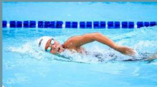
Gambar 3. Seseorang berenang

Adapun contoh penerapan hukum 3 newton dalam kehidupan sehari-hari yaitu :