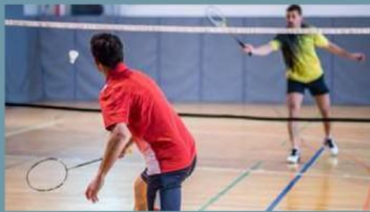
Gambar 2. Seseorang bermain bulu tangkis