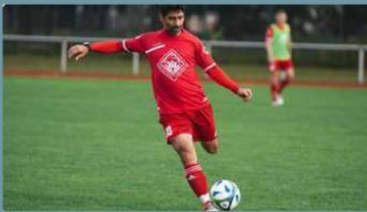
Gambar 1. Seseorang bermain sepak bola

Adapun contoh penerapan hukum 2 newton dalam kehidupan sehari-hari yaitu :