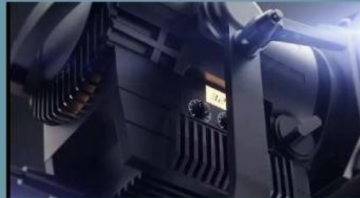
Video 1. Kecelakaan beruntun

Sumber : https://youtu.be/KXyoy66WVn4? si=hZQdHKikJ9x7weDL