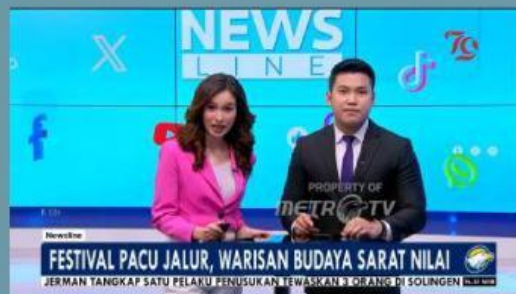
Video 2. Festival pacu jalur