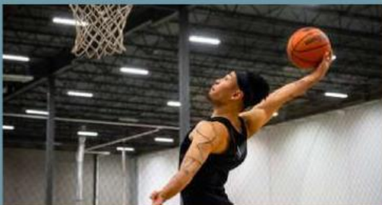
Gambar 3. Seseorang bermain basket