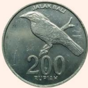
Gambar 1. Koin

Perhatikan gambar koin dan dadu dibawah ini!