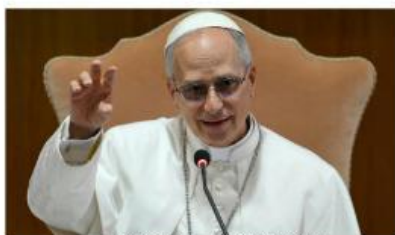
PAPA LEÓN XIV