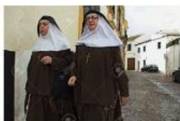
Hermanas de la Cruz (Religiosas)

Es el sucesor de Pedro, el amigo de Jesús, el encargado de guiar a la Iglesia Universal, y el representante de Cristo en la tierra. Él vive en Roma, y desde allí dirige la Iglesia