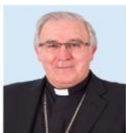
José Ángel Salz Meneses (Arzobispo de Sevilla)