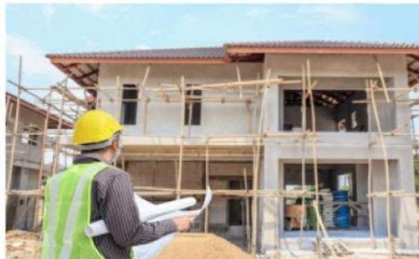
Gambar 7. Proyek Pembangunan Rumah

Perhatikan Masalah yang Disajikan Berikut ini!