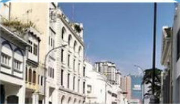
Kota tua Medan