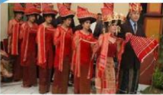
Tari piso surit

Silahkan tarik garis dari lajur kanan ke kiri sehingga menjadi jawaban yang benar