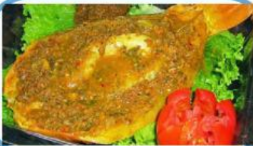
Makanan khas Sumatera Utara