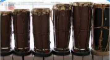
Alat musik tradisional