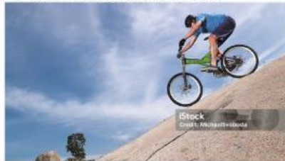
Gambar 3.1. Sepeda menuruni sebuah bukit

Coba kamu perhatikan apabila sebuah sepeda bergerak menuruni sebuah bukit, bagaimanakah kecepatannya? Atau pada peristiwa jatuh bebas, benda jatuh dari ketinggian tertentu di atas, Tentu saja kecepatan nya semakin bertambah besar.