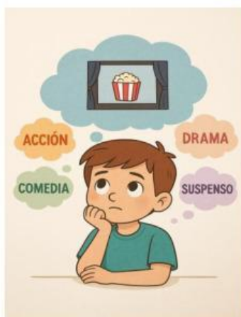
Tipo de películas preferidas por 100 personas