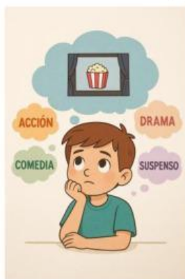
Tipo de películas preferidas por 100 personas

Miguel, por el día del estudiante organizó juntamente con el director de su escuela, la visita al cine para poder ver una película. Para decidir qué película se verá, realizó una encuesta y elaboró una tabla de frecuencias. ¿Cómo representaría los datos obtenidos?