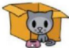
In front of