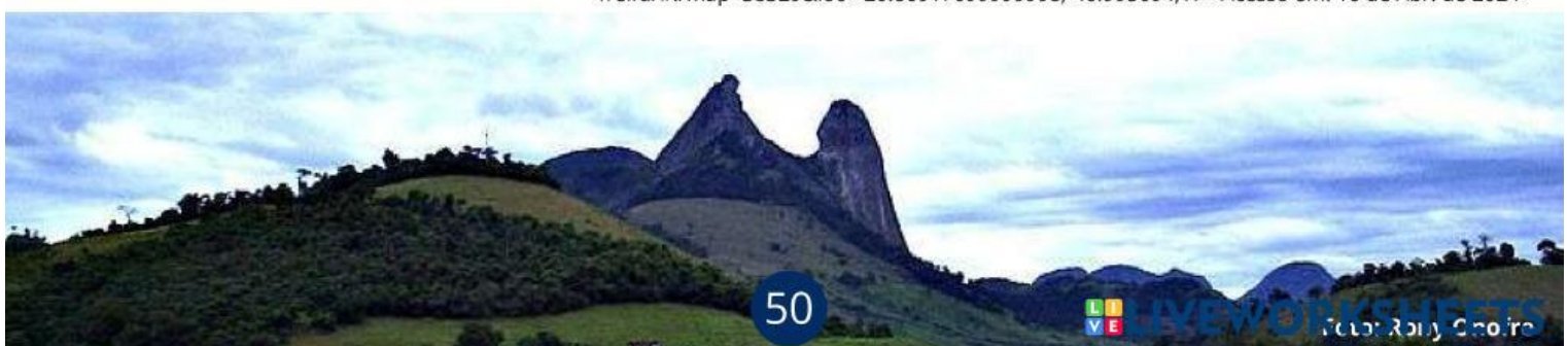
Imagem disponível em: < https://www.ipatrimonio.org/cachoeiro-de-itapemirim-pedra-do-frade-e-da-freira/#!/map=38329&loc=-20.869170999999998,-40.995094,17 > Acesso em: 16 de Abr. de 2024

5. Há, no lugar em que você mora, alguma peça feita de mármore? Qual?