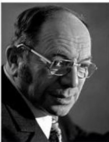
Leonid Vitaliyevich Kantorovich

Apa kalian tahu apa itu program linear ?