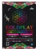
บัตรคอนเสิร์ต