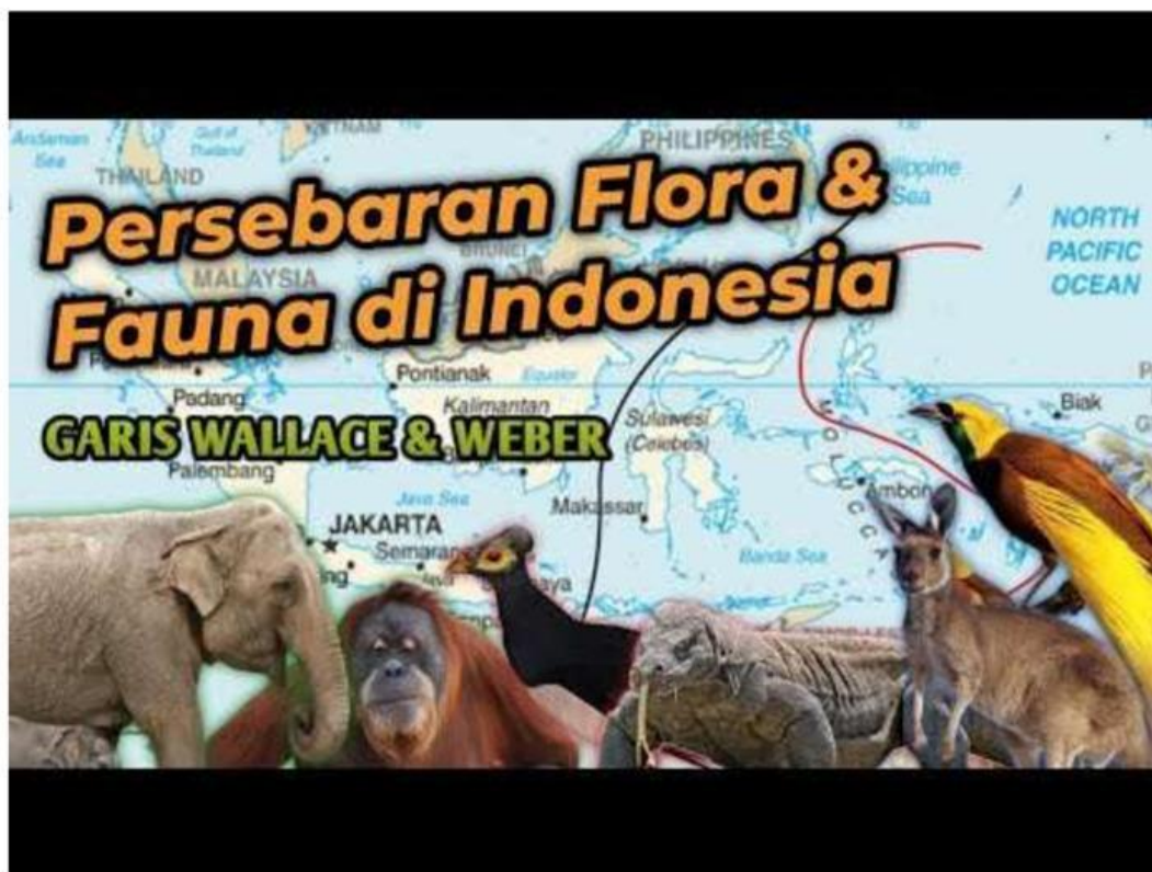
Video: Persebaran flora dan fauna

Untuk menambah wawasan kalian pada materi di pertemuan kali ini, anda bisa melihat video tentang persebaran flora dan fauna di bawah ini!