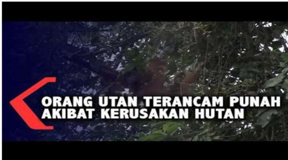
Video: Orang utan terancam punah

Lihatlah dan amatilah video berikut ini dengan baik!