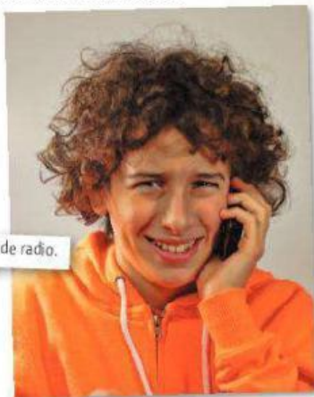
Jaime llama al programa de radio.

B. Ahora escucha este programa de radio en el que llama gente para encontrar novio o novia. ¿Cómo es Jaime? Escribe su descripción en tu cuaderno.