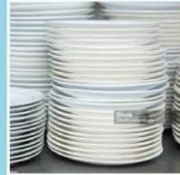
1 gros = 12 lusin = 144 buah

Dalam kehidupan sehari-hari, kita butuh satuan untuk menghitung atau mengukur sesuatu, seperti piring kita suka membelinya dalam satuan lusin atau baju dalam satuan kodi, atau misalkan gula pasir kita beli dalam satuan Kg. bukan butiran. Kenapa? karena, jika kita membeli gula pasir dalam satuan butir, dapatkah kita menghitungnya? Hal tersebut sudah menjadi ketetapan dan semua orang mengetahuinya. Nah bayangkan dalam kimia yang melibatkan sekumpulan partikel yang sangat kecil dan banyak, tentu juga memerlukan satuan, dan satuan tersebut diakui secara Internasional. Lalu, satuan apa yang dapat digunakan untuk partikel-partikel tersebut? Kita akan mempelajarinya pada pertemuan kali ini