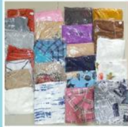
1 kodi = 20 buah