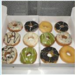
1 lusin = 12 buah