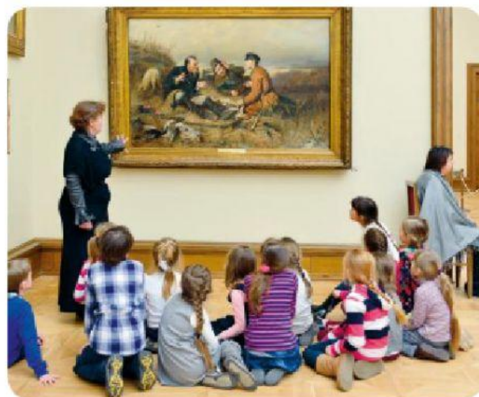
Monitor apresentando uma obra de arte a um grupo de crianças.

Você já visitou algum museu? Foi recebido por um monitor? O que você achou da visita?