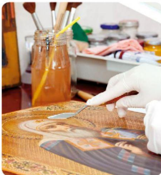
Detalhe de uma obra de arte em restauração.

Ele também trabalha constantemente para que as obras permaneçam mais conservadas por um maior período de tempo.