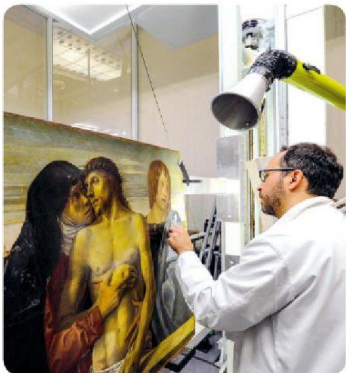
Restaurador trabalhando em uma obra de arte.

Profissional responsável pela manutenção e cuidado de obras de arte e livros antigos, documentos históricos, entre outras peças e papéis. Geralmente formado em química e conhecedor da história e das artes, esse profissional conserta as peças mais antigas para que pareçam mais novas.