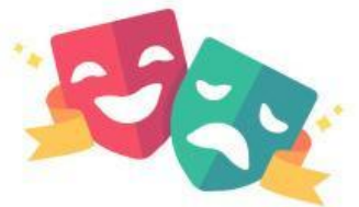
Día Mundial del Teatro