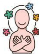
Día Internacional de la Felicidad