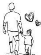
Día del padre San José