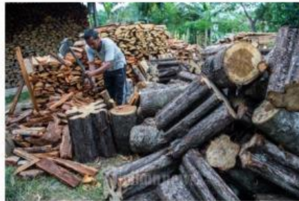
Gambar 1. Pembelahan Kayu Bakar

Gambar di atas terlihat orang sedang memotong kayu bakar untuk digunakan sebagai bahan bakar memasak. Sebelum penggunaan minyak tanah dan gas LPG, kayu bakar merupakan bahan bakar yang lazim digunakan untuk memasak. Tapi tahukah kalian mengapa kayu bakar selalu dibelah terlebih dahulu sebelum digunakan? Apakah kalian tahu apa hubungan ukuran kayu tersebut dengan cepatnya reaksi pembakaran?