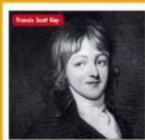
Francis Scott Key