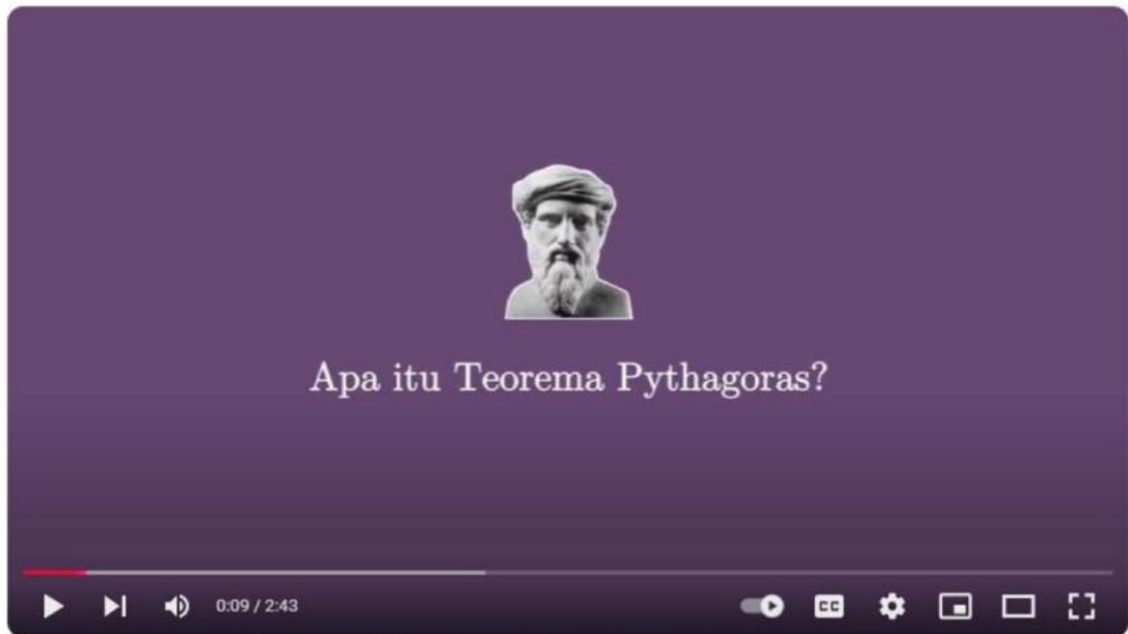
Teorema Pythagoras dan Pembuktian dengan Animasi

Di sini kalian akan belajar pembuktian Teorema Pythagoras! Siap-siap untuk paham sama teorema ini! Yuk, tonton video di bawah ini dan siap-siap menjawab beberapa pertanyaan!