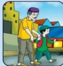
Membantu orang lain