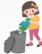
Membuang sampah pada tempatnya