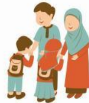
Menghormati orang tua