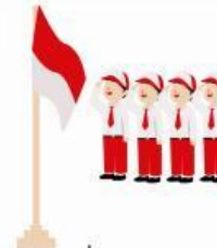
Siswa sedang upacara