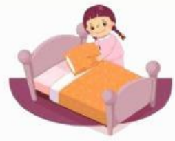
Merapikan tempat tidur