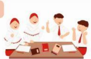
Siswa sedang berdiskusi kelompok