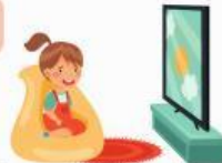
Menonton Tv seharian