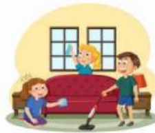
Menjaga kebersihan lingkungan