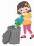
Membuang sampah pada tempatnya