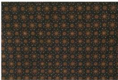
Gambar 1. Batik Truntum

Batik merupakan warisan budaya Indonesia yang telah diakui UNESCO. Yogyakarta terkenal sebagai salah satu pusat batik di Indonesia dengan berbagai motif khasnya. Diantaranya adalah Batik Truntum, Batik Parangkusumo, dan Batik Ceplok Kesatrian.