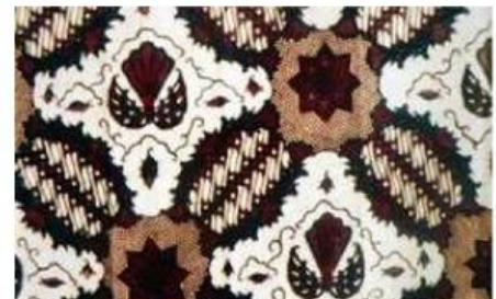
Gambar 3. Batik Ceplok Kesatrian

Batik Truntum memiliki motif berbentuk bunga kecil seperti bintang yang bertebaran. Motif ini melambangkan cinta yang tulus tanpa syarat, abadi, dan semakin lama semakin subur berkembang. Batik ini sering digunakan dalam upacara pernikahan oleh orang tua pengantin. Batik Parangkusumo adalah salah satu motif tertua dan paling sakral dalam batik Yogyakarta. Motif ini terdiri dari garis-garis diagonal yang melambangkan ombak lautan, menggambarkan semangat yang tidak pernah padam dan kekuatan dalam menghadapi tantangan hidup.