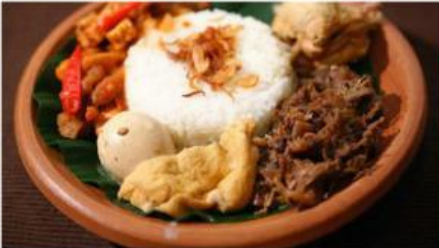
Gambar 1. Gudeg

Yogyakarta, atau yang akrab disebut Jogja, dikenal sebagai salah satu daerah di Indonesia yang kaya akan budaya dan tradisi. Tidak hanya terkenal dengan keraton, seni batik, dan candi-candi bersejarah, Jogja juga memiliki kekayaan kuliner yang menggugah selera. Berbagai makanan khas daerah ini mencerminkan keunikan cita rasa tradisional yang dipengaruhi oleh warisan budaya lokal. Beberapa hidangan legendaris Yogyakarta diantaranya adalah gudeg, sate klathak, dan wedang ronde. Setiap makanan ini memiliki cerita dan cita rasa khas yang tidak hanya memanjakan lidah, tetapi juga membawa nuansa kearifan lokal yang melekat dalam kehidupan masyarakat Jogja.