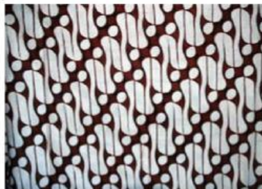
Gambar 2. Batik Parangkusumo