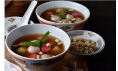
Gambar 3. Wedang Ronde

Gudeg adalah makanan khas Yogyakarta yang terbuat dari nangka muda (gori) yang dimasak dengan santan, gula merah, dan rempah-rempah. Gudeg memiliki rasa manis, warna cokelat tua dan kemerahan, dan tekstur santan yang kental. Sate klathak adalah makanan khas Yogyakarta yang terbuat dari daging kambing yang dibakar menggunakan tusuk besi dan dibumbui garam. Disebut Sate klathak karena garam yang ditabur ke daging saat dibakar menciptakan suara klathak-klathak. Wedang ronde adalah minuman yang terbuat dari kuah jahe hangat dan bola-bola tepung ketan yang disebut ronde.