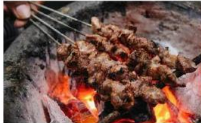
Gambar 2. Sate Klathak