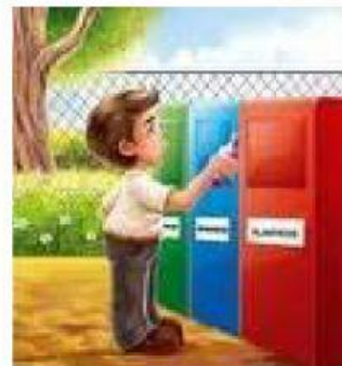
Depositando la basura en su lugar