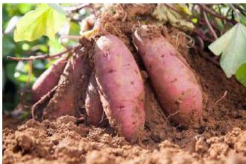
Tumbuhan Ubi Jalar