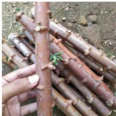
Tumbuhan Ubi Jalar