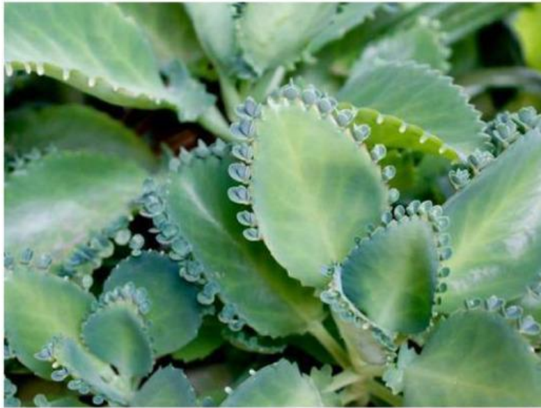
Tumbuhan Cocor Bebek

Lihatlah gambar di bawah ini, amati kemudian buatlah penjelasan dari perkembangbiakan tumbuhan tersebut dengan bahasamu sendiri!