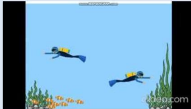
video 1. Penyelam

Tekanan didefinisikan sebagai gaya tiap satuan luas. Tekanan hidrostatik yaitu tekanan yang dialami oleh suatu benda di dalam suatu fluida oleh zat cair di atasnya.