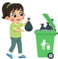
Membuang sampah pada tempatnya

Apakah gambar tersebut sesuai dengan aturan dirumah atau tidak