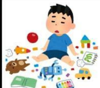
Tidak dibereskan sehabis bermain