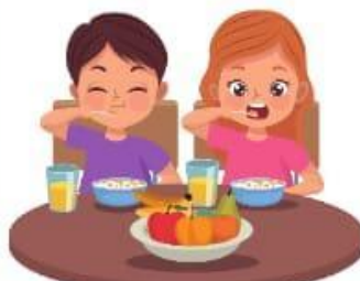
Makan dimeja makan