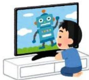
Metonton tv dengan jarak dekat