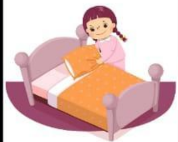
Merapikan tempat tidur