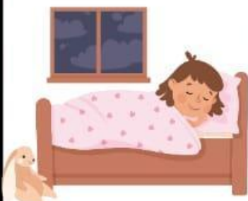
Tidur terlalu larut malam