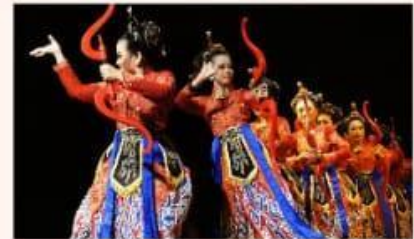
Tari Jaipong, Jabar

Indonesia merupakan bangsa majemuk yang kaya akan budayanya. Salah satu kekayaan budaya yang kita punya adalah tarian adat beragam yang berasal dari berbagai daerah. Gambar di atas menunjukkan beberapa tarian yang ada di Indonesia. Tarian kita sudah banyak dikenal di dunia, salah satunya seperti gambar di bawah ini: