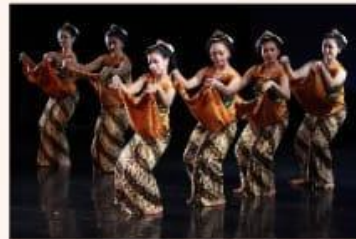
Tari Serimpi, Jateng