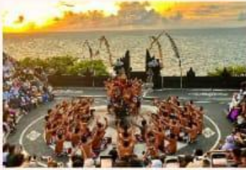
Tari Kecak, Bali