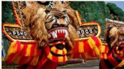
Tari Reog Ponorogo, Jatim