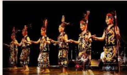
Tari Giring-giring, Kalteng