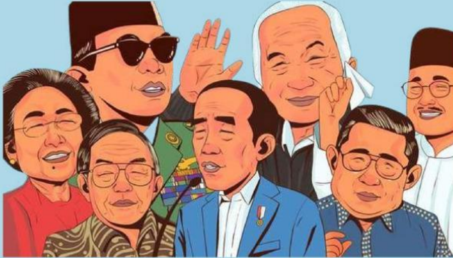
Gambar 1. Deretan Presiden Indonesia