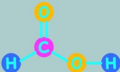
Struktur asam formiat

Ketika kita disengat lebah, lebah menyuntikkan racun ke dalam kulit. Racun ini mengandung beberapa senyawa, termasuk asam formiat. Asam formiat secara alami terdapat pada sengatan lebah dan semut , sehingga dikenal pula sebagai asam semut. Asam formiat memiliki pH 3-4. Rasa sakit di kulit setelah disengat lebah disebabkan karena asam formiat dalam racun lebah berinteraksi dengan sel-sel saraf di kulit. Hal inilah yang menyebabkan rasa sakit yang tajam. Selain itu, racun ini juga dapat memicu reaksi inflamasi yang menyebabkan kulit menjadi merah, bengkak, dan panas.