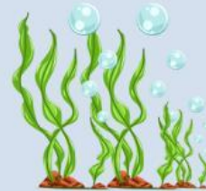
tumbuh pohon baru