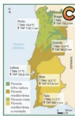
Principais formações vegetais e características térmicas e pluviométricas anuais em Portugal.