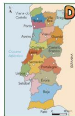
Mapa dos distritos de Portugal continental.