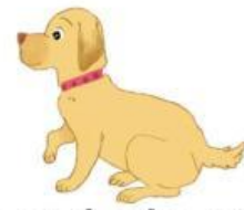
Con chó cân nặng