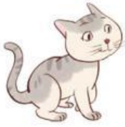
Con mèo cân nặng

Chọn thẻ ghi cân nặng thích hợp với mỗi con vật sau: