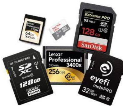
Tarjeta de memoria