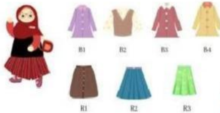
Gambar Koleksi Baju dan Rok Arumi

Kamila dan Mela berasal dari tempat tinggal yang berbeda ingin berangkat kesekolah. Kamila memiliki 4 rute (A, B, C, D) untuk menuju sekolah sedangkan Mela memiliki 2 rute (P,Q) untuk menuju ke sekolah. Berapa banyak cara untuk Kamila dan Mela menuju ke sekolah ?