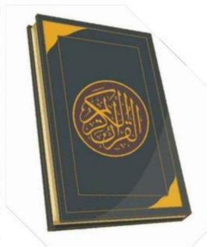
Gambar 2.4 Ilustrasi Kitab al-Qur'an

Siswa yang budiman, sebagai seorang mukmin, kita wajib meyakini semua kitab dan suhuf yang disebutkan di dalam al-Qur'an itu. Namun, kalian harus tahu, bahwa ada tradisi dan sejarah yang berbeda-beda antar masing-masing agama yang menyebabkan perbedaan cara pandang terhadap kitab suci masing-masing. Tradisi dan sejarah yang berbeda-beda itu menyebabkan kitab Taurat yang diyakini oleh bangsa Yahudi dan kitab Injil yang diyakini oleh umat Nasrani pada saat ini berbeda dengan kitab Taurat dan Injil yang dimaksudkan dalam al-Qur'an.