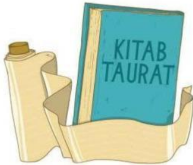
Gambar 2.1 Ilustrasi Kitab Taurat

Kitab Taurat adalah kitab yang diturunkan oleh Allah Swt. kepada Nabi Musa a.s. Allah Swt. berfirman di dalam Q.S. al-Maidah/5: 44 bahwa kitab Taurat merupakan petunjuk bagi Nabi Musa a.s. dan nabi-nabi dari Bani Israil sesudahnya, sampai kepada Nabi Isa a.s. Mereka disebut sebagai nabi-nabi yang telah menyerahkan diri kepada Allah dengan penuh keikhlasan.