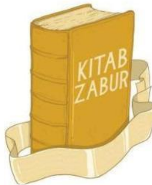
Gambar 2.2 Ilustrasi Kitab Zabur

Kitab Zabur adalah kitab yang diturunkan oleh Allah Swt. Kepada Nabi Daud a.s. Nabi Daud a.s. merupakan salah satu nabi dari Bani Israil. Sebagai nabi dari Bani Israil, Nabi Daud menggunakan kitab Taurat untuk memutuskan berbagai perkara orang-orang Yahudi. Namun kepada Nabi Daud a.s., Allah Swt. juga menurunkan kitab Zabur. Menurut Imam Qurtubi, sebagaimana dikutip dalam Tafsir Quran Kemenag, kitab Zabur tidak berisi hukum-hukum perkara seperti Taurat. Namun kitab Zabur terdiri dari 150 surah yang berisi nasihat-nasihat, hikmah, pujian dan sanjungan kepada Allah Swt.