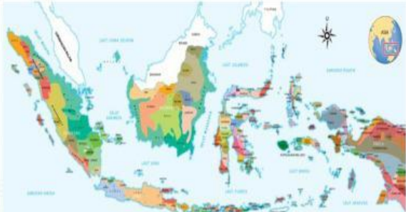
SUKU BANGSA DI INDONESIA