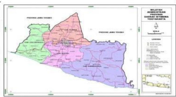
Peta Wilayah Administrasi DIY dengan Skala 1: 500.000