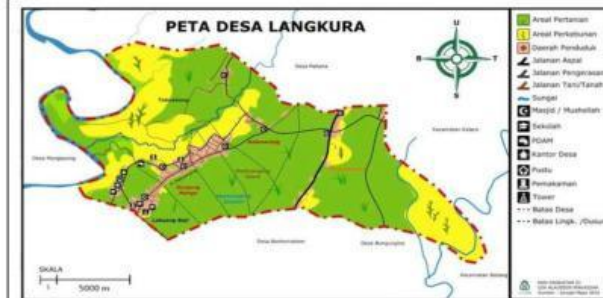
Peta Wilayah Administrasi Desa Langkura dengan Skala 1: 500.000