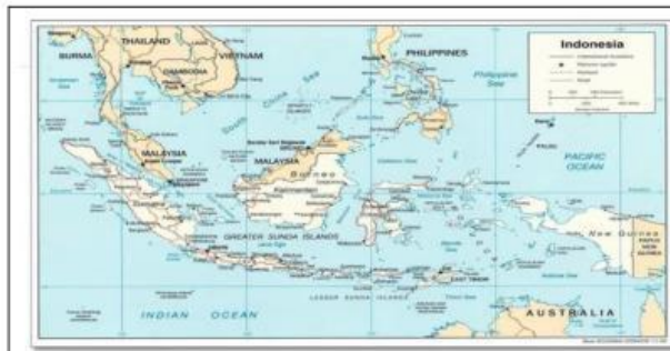
Peta Indonesia dengan Skala 1: 20.000.000