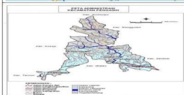
Peta Administrasi Kecamatan Pengasih dengan Skala 1: 100.000